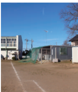
葛城小学校 児童クラブ

議員 葛城小学校区内に住民登録のある0歳から12歳の人数を基本としており、今後、転入転出などにより人数は前後します。児童生徒数増加による教室不足には、多目的室などを普通教室へ転用することや校舎増築などで対応します。