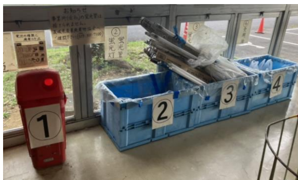
桜総合体育館回収拠点の様子

注意！ 事業所から出る蛍光管や乾電池は、産業廃棄物です。市では処理できないので民間の産業廃棄物処理業者へ御相談ください。