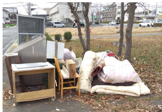
集積所に放置された粗大ごみ