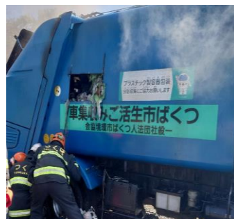
ごみ収集車火災事故の様子