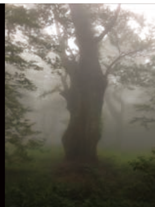
筑波山のブナの巨木