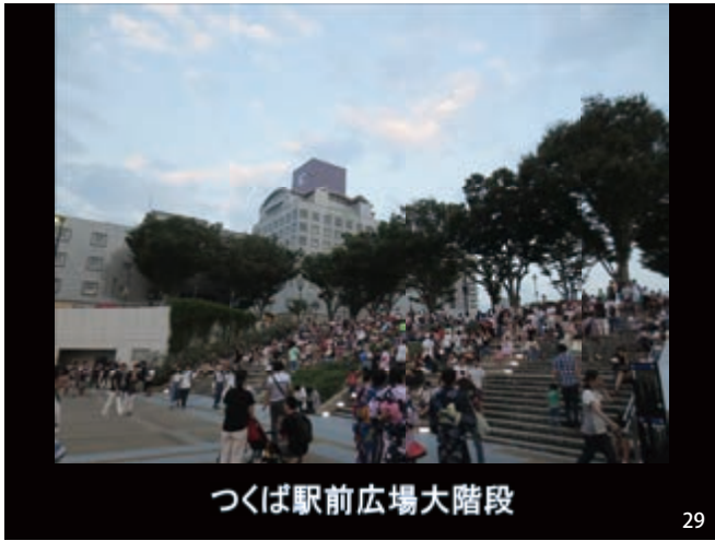
つくば駅前広場大階段