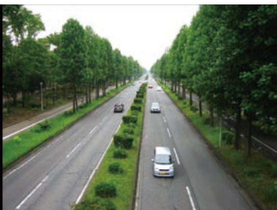
西大通りのユリノキの街路樹