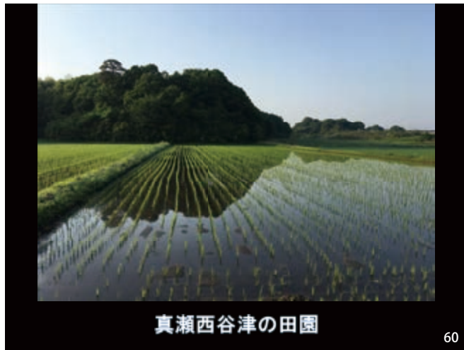
真瀬西谷津の田園