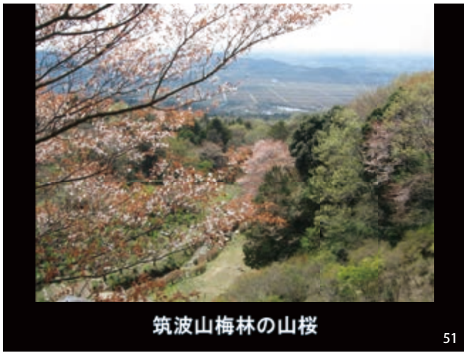
筑波山梅林の山桜