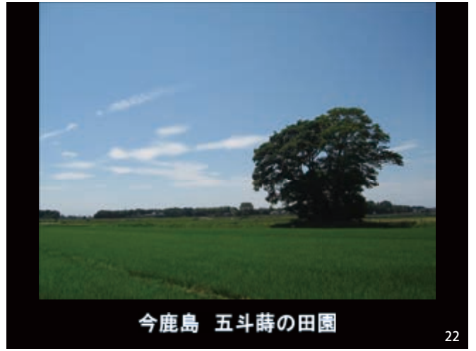
今鹿島 五斗蒔の田園