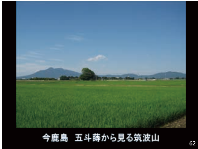
今鹿島 五斗蒔から見る筑波山