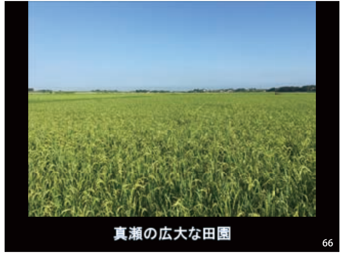
真瀬の広大な田園