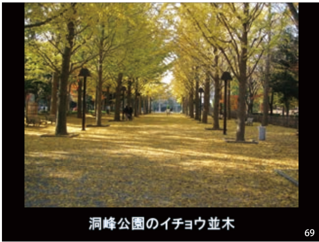
洞峰公園のイチョウ並木