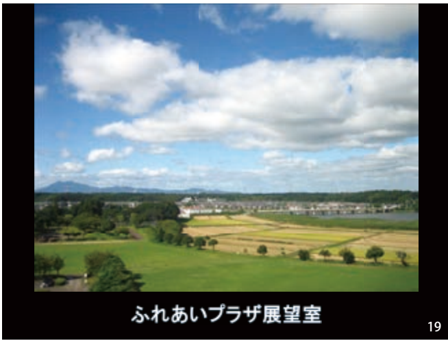
ふれあいプラザ展望室