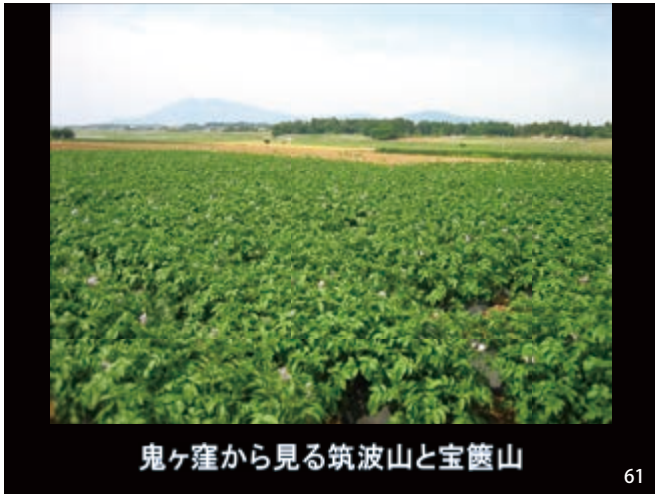
鬼ヶ窪から見る筑波山と宝篋山