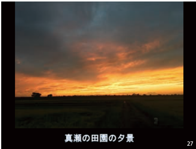
真瀬の田園の夕景