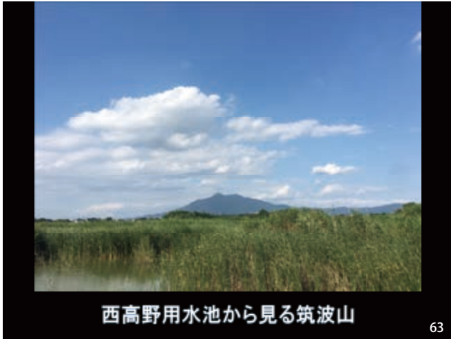
西高野用水池から見る筑波山