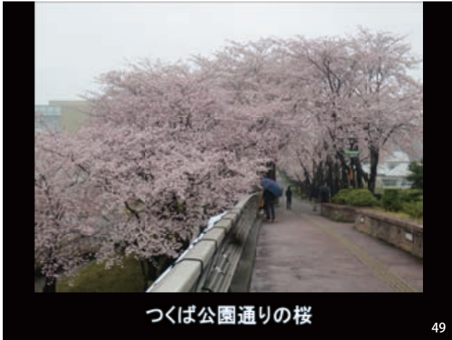
つくば公園通りの桜