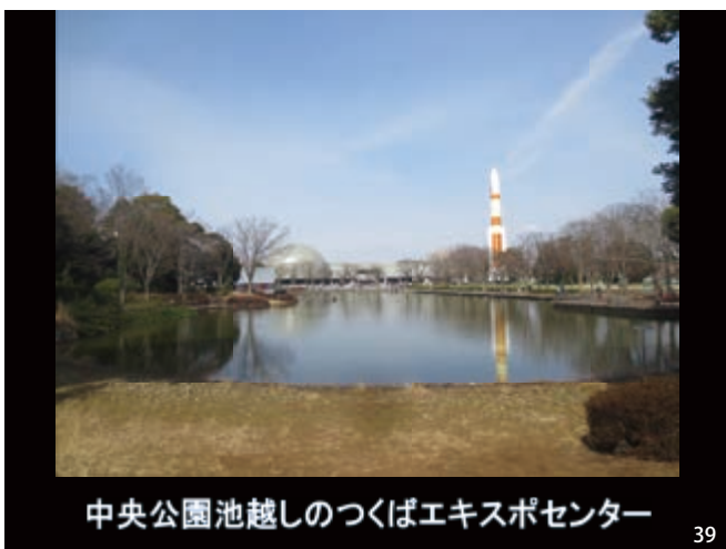
中央公園池越しのつくばエキスポセンター