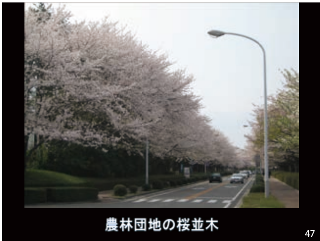
農林団地の桜並木