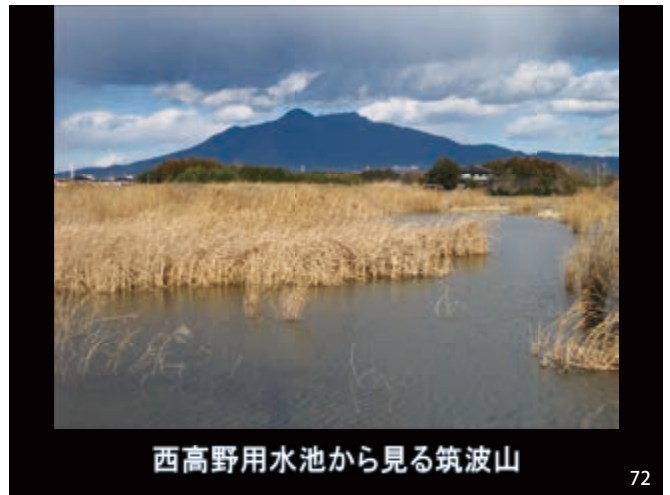
西高野用水池から見る筑波山