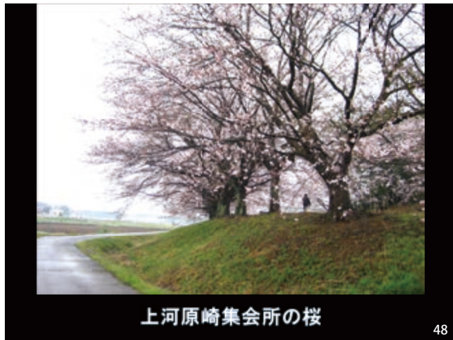
上河原崎集会所の桜