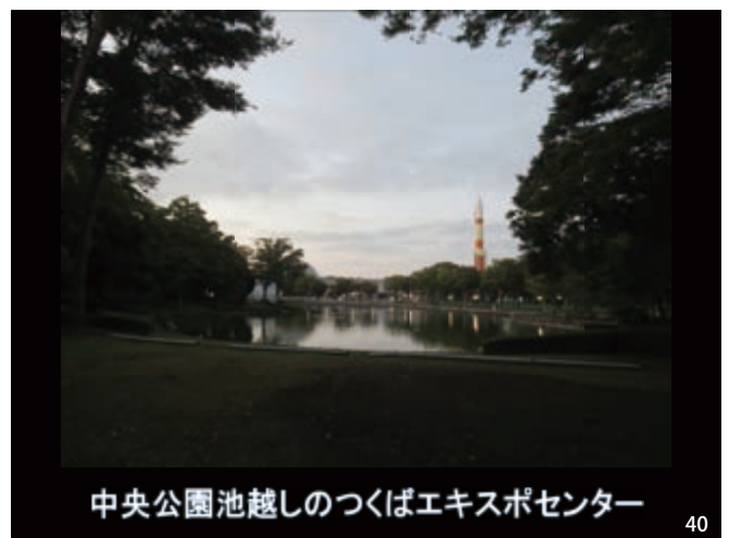
中央公園池越しのつくばエキスポセンター