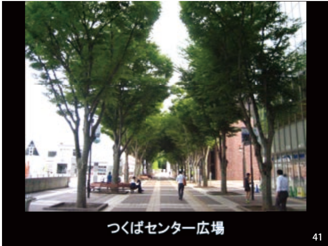
つくばセンター広場