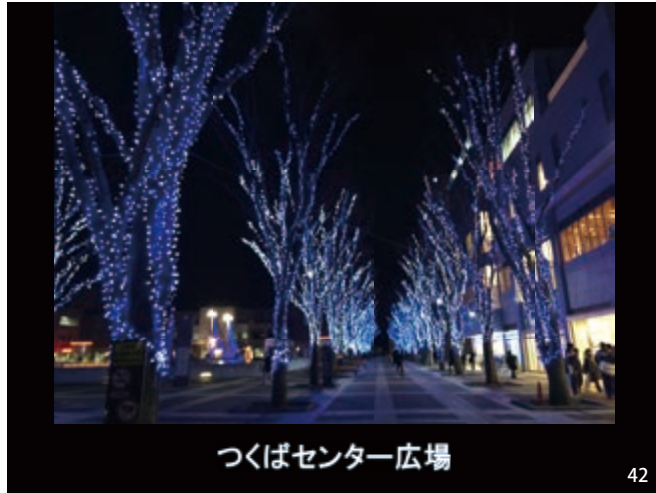
つくばセンター広場