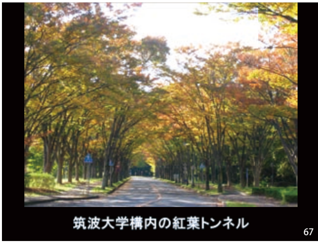
筑波大学構内の紅葉トンネル