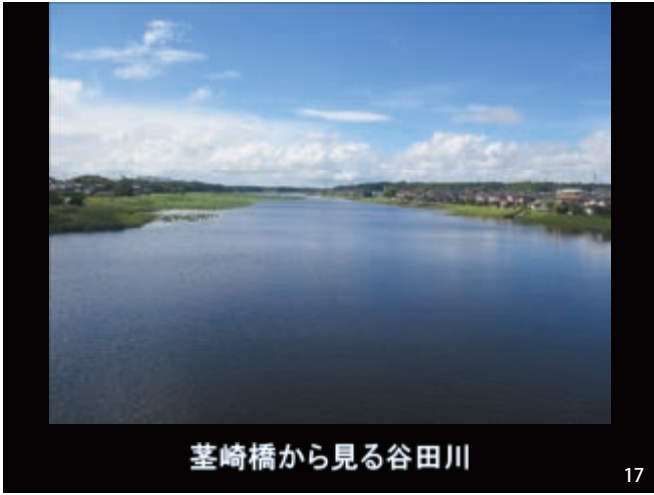
荃崎橋から見る谷田川