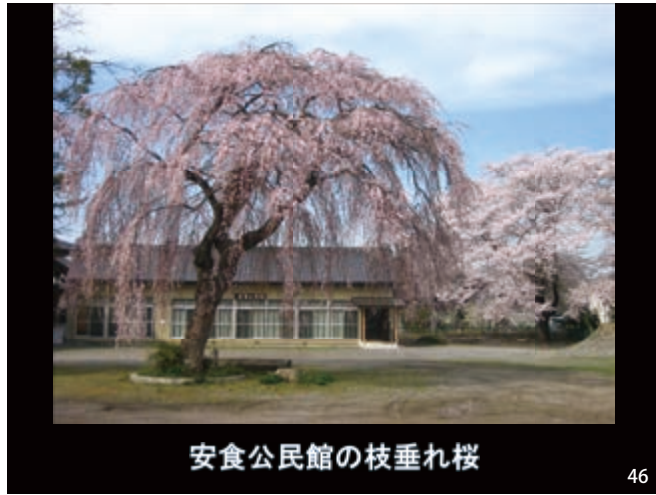
安食公民館の枝垂れ桜