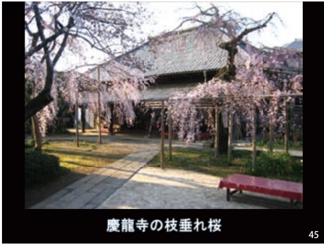
慶龍寺の枝垂れ桜