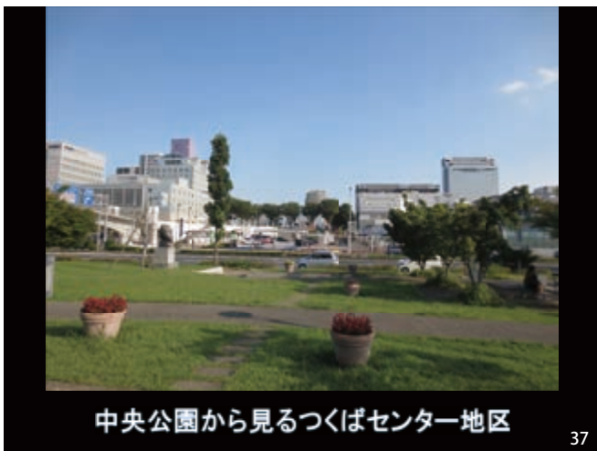
中央公園から見るつくばセンター地区