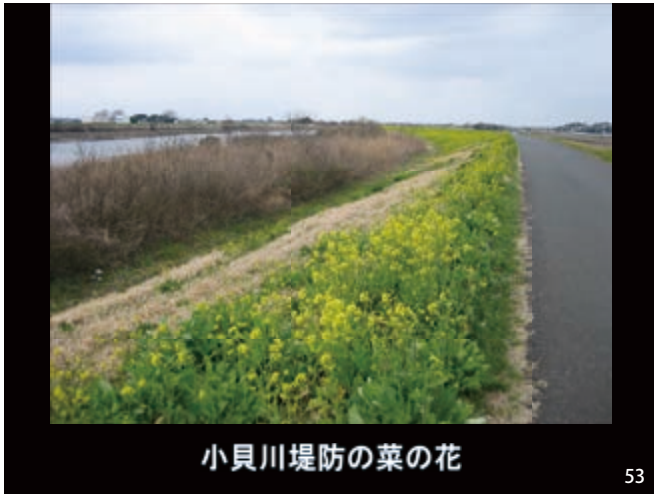
小貝川堤防の菜の花