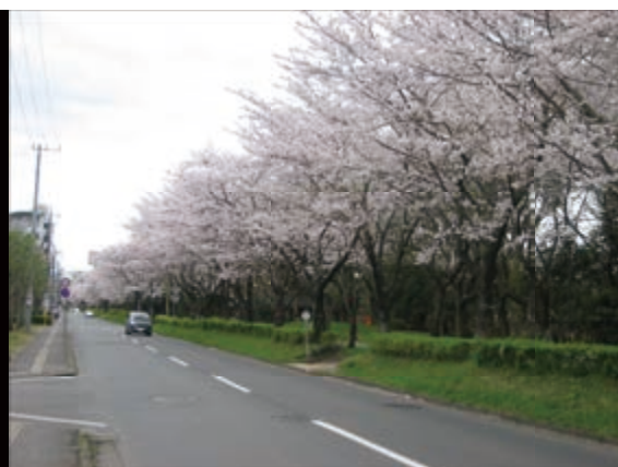
筑波大学追越・平砂宿舎の桜並木