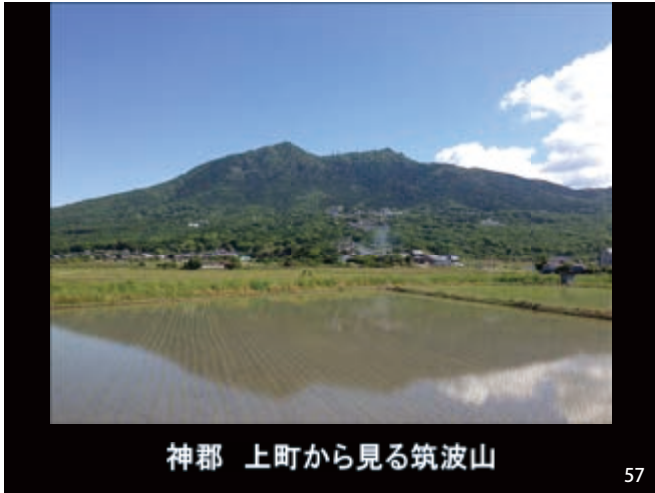
神郡 上町から見る筑波山