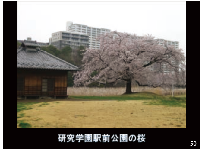
研究学園駅前公園の桜