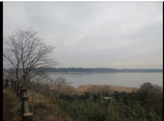
泊崎から望む牛久沼