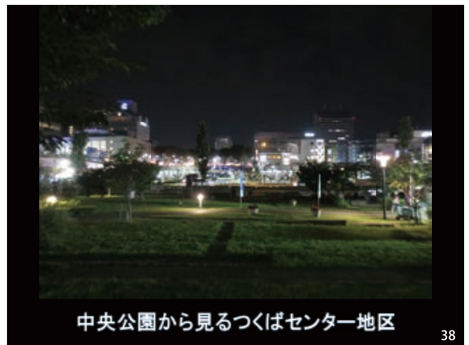
中央公園から見るつくばセンター地区