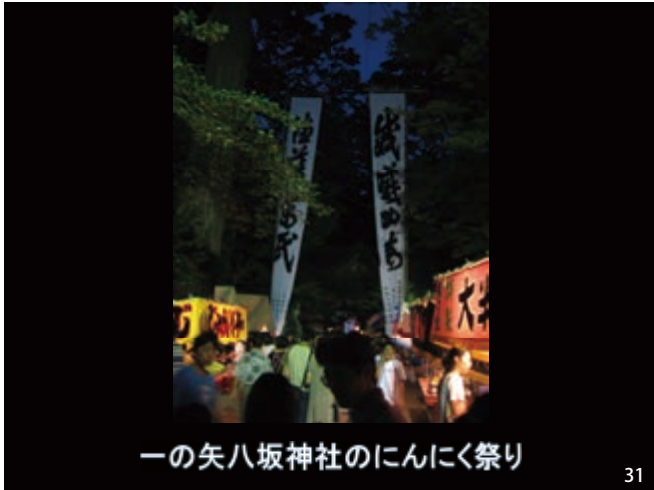
一の矢八坂神社のにんにく祭り