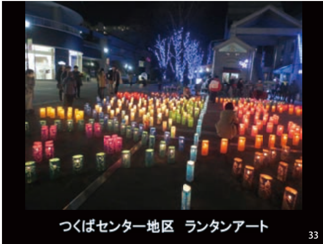
つくばセンター地区 ランタンアート