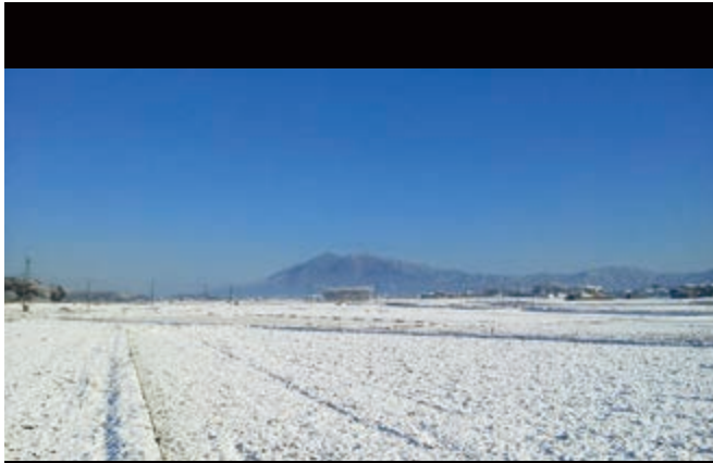
沼崎から見る筑波山