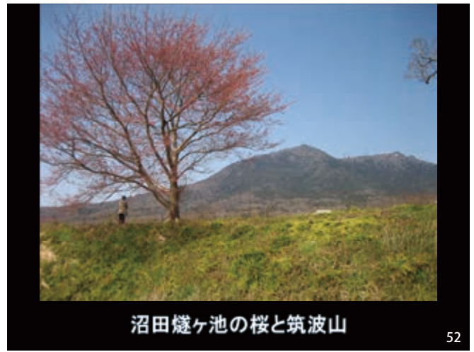
沼田燧ヶ池の桜と筑波山