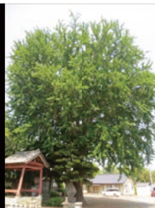
栗原の大イチョウ