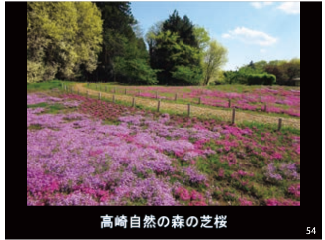
高崎自然の森の芝桜