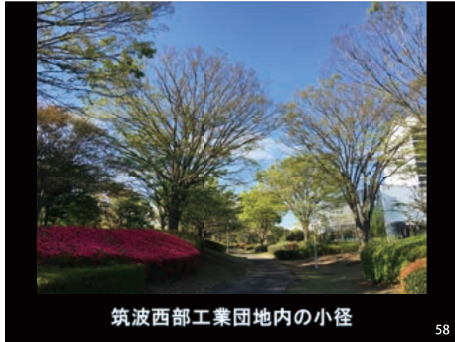
筑波西部工業団地内の小径