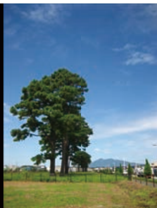
学園の森のテーダ松並木