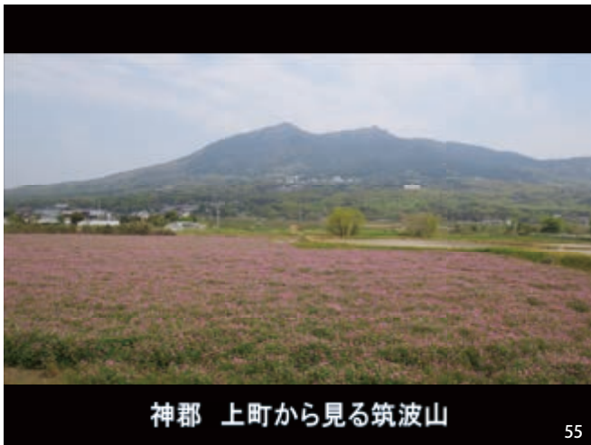
神郡 上町から見る筑波山