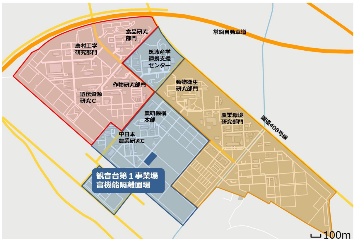
図 1 つくば市観音台地区周辺の地図と観音台第 1 事業場高機能隔離圃場の配置